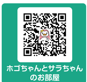
ホゴちゃんとサラちゃん のお部屋