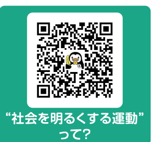
“社会を明るくする運動” って?