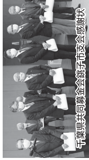
千葉県共同募金会銚子市支会感謝状