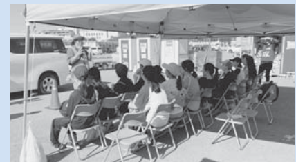
災害ボランティアセンターの様子

被災地で起こった問題や課題から学んだことを未来へ活かすため、銚子市社協においても、日頃からの訓練や研修に加えて、行政や関係団体との連携を密にしていくことや、市民の皆様への災害ボランティアの啓蒙活動にも、注力していきたいと考えています。