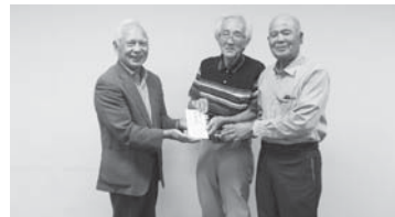
銚子市シニアクラブ連合協議会