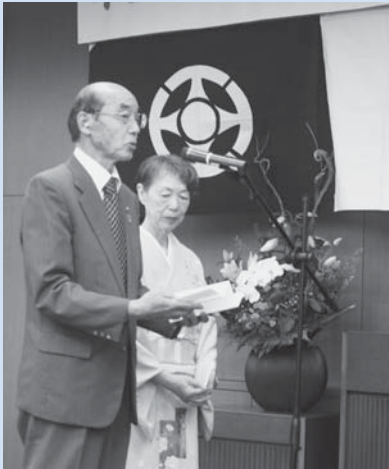
塚本ご夫妻からのお礼の言葉