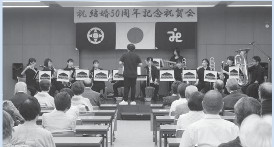
ベルモンテウインドオーケストラによる演奏

9月7日（土）銚子市保健福祉センターにて、結婚50周年記念祝賀会を開催しました。