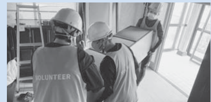
活動する学生ボランティア