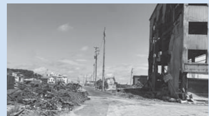
被災後の輪島朝市